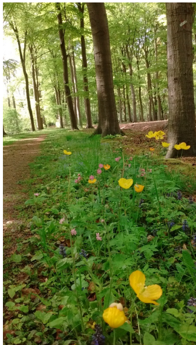
bloemrijk randje in het Maartensdijkse bos

Agrarisch natuurbeheer is erop gericht de natuurwaarden te vergroten. In het Noorderpark wordt breed door boeren en grondeigenaren ingezet op meer natuur en meer biodiversiteit. Om te volgen of de maatregelen effect hebben, is een lijst van doelsoorten opgesteld door de provincie Utrecht. In de nieuwsbrieven vertellen we over enkele van die kenmerkende soorten, die je kunt tegenkomen bij fiets- en wandeltochten in het Noorderpark.