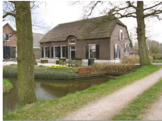
Boerderij van het jaar 2011

www.utrechtseboerderijen.nl , kies voor het menu-item "Boerderij van het jaar 2012".